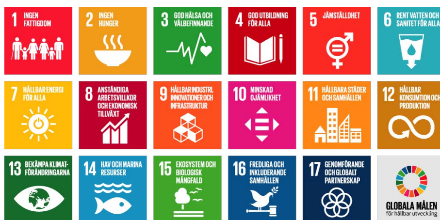
De 17 globala målen för hållbar utveckling. Illustration: FN

Precis som de 17 globala målen är odelbara och hänger ihop är miljöfrågor ofta komplexa. Detta gör att vissa mål och indikatorer kan ha koppling till flera målinriktningar. Målen finns dock bara med på ett ställe även om de har påverkan på flera av målinriktningarna.