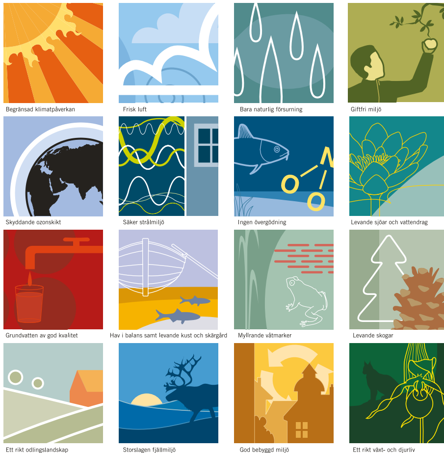
Illustration över Sveriges 16 miljökvalitetsmål som beskriver det tillstånd i den svenska miljön som miljöarbetet ska leda till. Illustration från Tobias Flygar för sverigesmiljömål.se.

Det svenska miljömålssystemet består av 16 miljökvalitetsmål inom områdena avfall, biologisk mångfald, farliga ämnen, hållbar stadsutveckling, luftföroreningar och klimat. Sveriges miljömål är det nationella genomförandet av den miljömässiga dimensionen av de globala hållbarhetsmålen. Genomförande av det miljöstrategiska programmet för Ockelbo bidrar till att uppnå de nationella miljömålen.